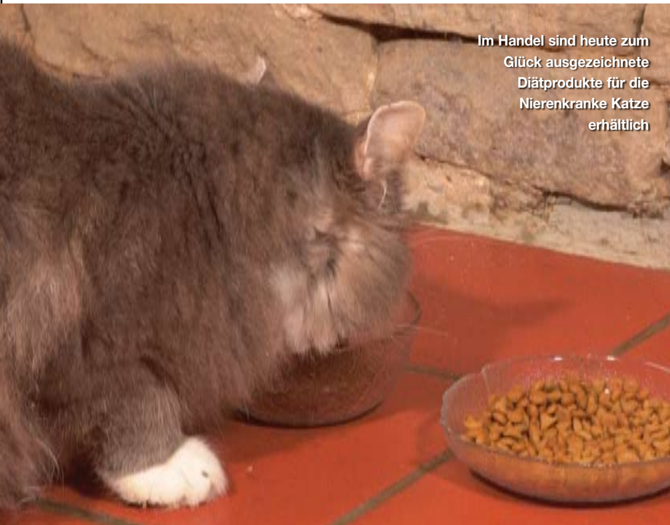
Im Handel sind heute zum Glück ausgezeichnete Diätprodukte für die Nierenkranke Katze erhältlich

Zu den weiteren Funktionen der Nieren gehören die Stabilisation der Elektrolyte (Kalium, Kalzium, Phosphor und Natrium), die Produktion von Erythropoetin, welches das Knochenmark anregt, rote Blutzellen zu produzieren,