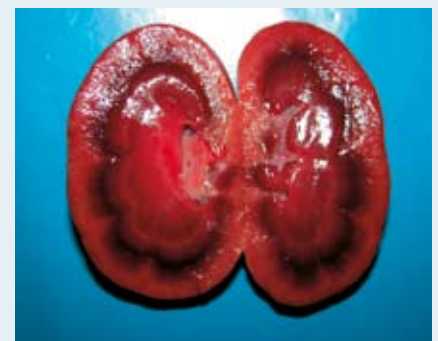
Makroskopisch, also das Organ mit dem Auge betrachtet, gesund (li.) und einmal hyperämisch (re.). Wir danken Dr. Gerhard Lösenbeck, Labor Laboklin, Bad Kissingen, der uns freundlicherweise die Aufnahmen zur Verfügung stellte. (Fotos: Dr. G. Lösenbeck)