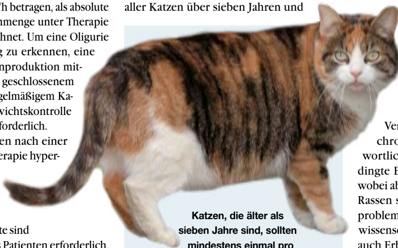
Katzen, die älter als sieben Jahre sind, sollten mindestens einmal pro Jahr zum Checkup beim Tierarzt

Die Vorstellung, dass nach wissenschaftlicher Meinung zirka zehn Prozent aller Katzen über sieben Jahren und